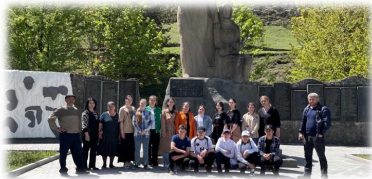
Акция "Спасибо деду за Победу!"